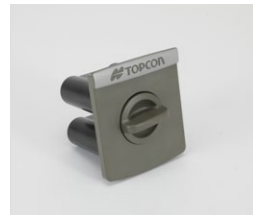
ニッケル水素 (Ni-MH) バッテリー BT-83Q