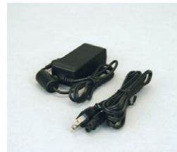
BT-83Q 用充電器 AD-11EA