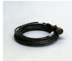
外部電源用ケーブル PC-18